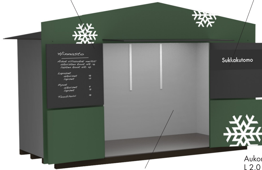
Aukon koko, kun kaikki luukut auki: L 2,0 x K 1,9 m

- Osassa kojussa tapahtuman Lahden Joulukylä -teksti. - Lisäksi vaihteleva määrä 1–3 kpl tapahtumagrafiikkaa (lumiähti).