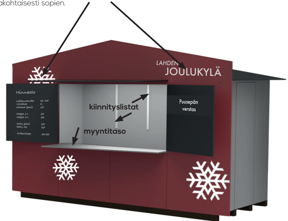
Aukun koko, kun yläluukut auki: L 2,0 x K 1,0 m